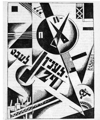
Обкладинка журналу "Фрейд" (№ 11, 1924) та ілюстрації номеру, присвяченого смерті В. Леніна

Робився на сторінках часопису акцент і на трудовому вихованні дітей — "Як працюють пролетарські діти в інших країнах" [7, № 10, с. 17] тощо.