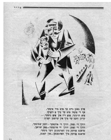
Дизайн обкладинки, титульна сторінка та ілюстрації журналу "Фрейд", виконані М. Епштейном