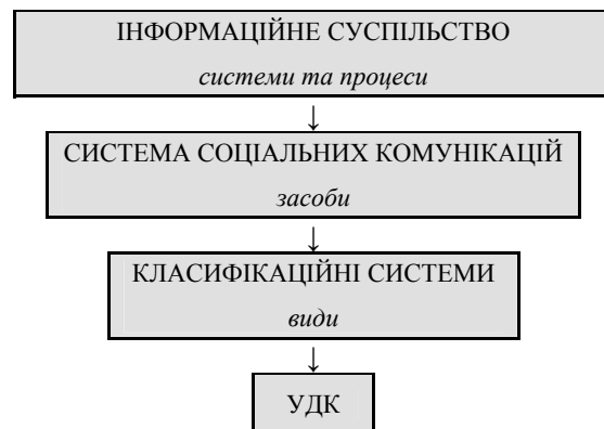
Схема. Місце УДК в системі соціальних комунікацій

Входження документа в соціальну комунікацію пов'язане з процесом систематизування (групування, класифікування). Визначення ролі класифікаційних систем з позиції соціальних комунікацій є актуальною проблемою сучасного бібліографознавства, бібліотекознавства, книгознавства, документознавства тощо. Класифікаційні системи, зокрема міжнародна Універсальна десяткова класифікація (УДК), посідають провідне місце у забезпеченні ефективності перебігу інформаційних процесів соціальних комунікацій (див. схему).