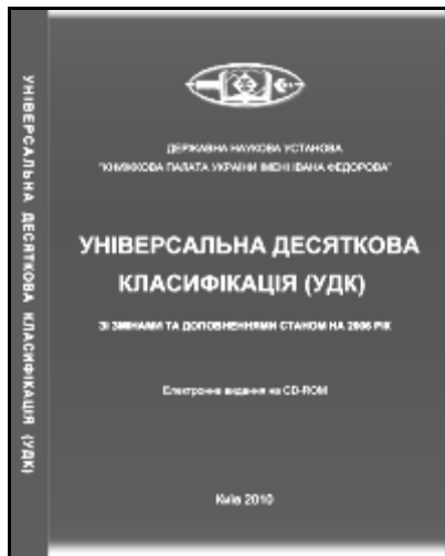
Рис. 1. Первинне пакування диска

Електронне видання УДК на CD-ROM. З метою впровадження національного еталона УДК та забезпечення бібліотек виданнями УДК було вирішено випустити в 2010 році електронне видання "Універсальна десяткова класифікація (УДК)" на CD-ROM у форматі PDF зі змінами та доповненнями станом на 2006 рік (див. рис. 1). Підготування електронного видання УДК здійснювалось на основі електронного інформаційного масиву другого видання УДК (виправленого і доповненого, зі змінами та доповненнями за 1997—2006 роки).