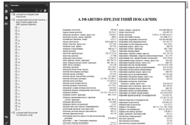
Рис. 3. Електронна форма Алфавітно-предметного показчика до УДК

Випуск електронного видання УДК дав змогу забезпечити актуалізованими таблицями УДК бібліотеки, які не отримали друковане видання, випущене на замовлення Держкомтелерадіо України за програмою "Українська книга", прискорив процес впровадження національного еталона УДК, а також полегшив процес пошуку необхідних понять та індексів, оскільки здійснюється автоматизованим, а не ручним способом.