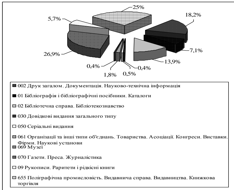
Діаграма В.1 — Розподіл публікацій за основними та додатковими рубриками УДК

У діаграмі В.1 представлено процентне співвідношення бібліографічних записів за індексами УДК.