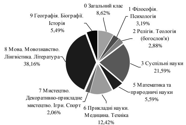
Діагр. 1. Розподіл книг та брошур за класами УДК

9 Географія. Біографії. Історія — 1064 записи, або 5,49%.